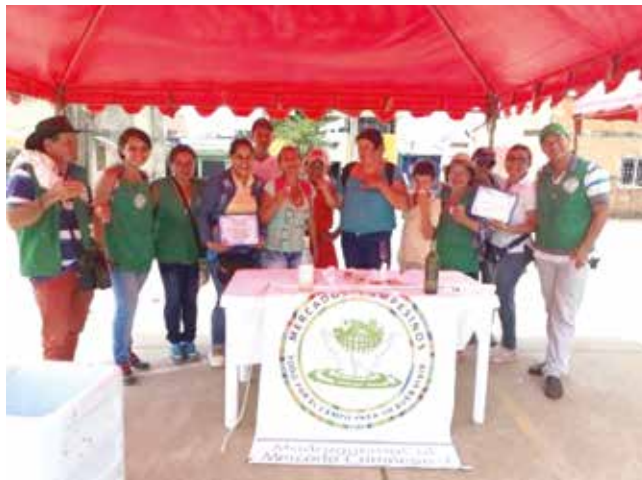
Imagen 28: Mercado Campesino

A través de la comida podemos conocer la vida de las comunidades campesinas, los ritos, las fiestas, sus tareas y costumbres. La comida y la cocina tienen que ver con el fortalecimiento de la identidad campesina a partir de lo que producen las familias en sus fincas y de los recursos en sus territorios, es un elemento que garantiza la seguridad, autonomía y soberanía alimentaria. En ese sentido es un proceso permanente del que hacen uso las comunidades.