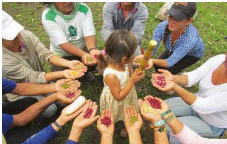
Registro Fotográfico de la PS.R

El proyecto vigente actualmente, gracias a la Cooperación de Caritas Luxemburgo ofrece acompañamiento a 85 familias de los departamentos del Meta y Guaviare, específicamente las veredas de Chaparrito, Alto Mielon, Mereles; en Guaviare Simón Bolívar, Acacias, La dos mil y baja unión comunidades que han sido afectados por diferentes grupos armados pero que han sabido sobreponerse a esa ola de violencia y están en búsqueda de mejores condiciones de vida. Son territorios de vocación agrícola y ganadera, en la región de la llanura y amazonia, con condición de suelos ácidos y dos estaciones marcadas una de verano, con escasez de agua, y otra de invierno con lluvia excesiva.