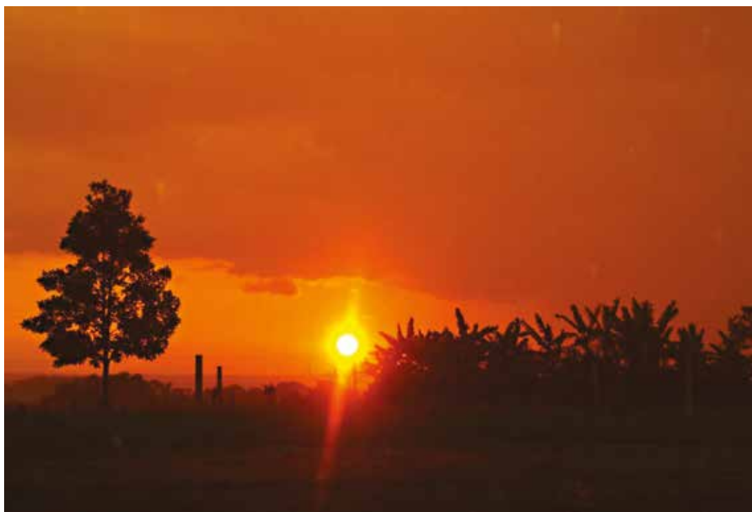
Imagen 25: Atardecer en la Vereda Chaparrito

Coordinación: Pastoral Social Regional Suroriente Colombiano 90