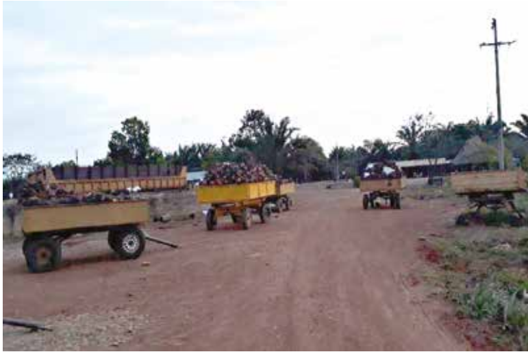
Registro Fotográfico dela P.S.R

Sin embargo, con la llegada de las Políticas de erradicación de cultivo de Coca del Gobierno Nacional, sin ningún plan de sustitución, las personas pasaron temporadas de difícil situación, principalmente hambre.