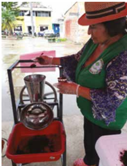
Registro Fotográfico de la P.S.R