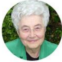
Chiara Lubich Fundadora del Moviment dels Focolars (Itàlia)

"La seva proposta consistia a crear empreses que competissin lliurement en el mercat i obtinguessin beneficis, però destinessin aquests beneficis a lluitar contra la misèria i l'exclusió, així com a desenvolupar i difondre una nova cultura econòmica oberta al do gratuït, a la reciprocitat, a la comunitat".