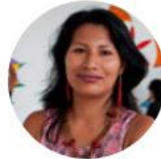
Yanua Atamain Poble Awajún-Perú

"La Humanitat no està prenent les mesures urgents necessàries per a protegir la nostra biosfera en perill".