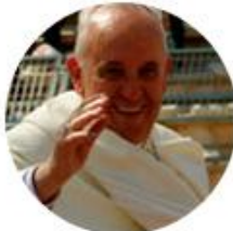
Papa Francesc Iglesia catòlica

Missatge conjunt del Papa Francesc i del Patriarca Ecumènic Bartomeu a la Jornada Mundial de Pregària per la Creació