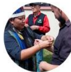
Pueblo Wapichana Brasil

"Respectar la natura és respectar-la, tal com és, admetre que és fruit d'una decisió amorosa del Creador, per als que creiem en Déu, o d'un conjunt de mutacions aleatòries de milions d'anys: en qualsevol cas, no som qui per a manipular-la al nostre caprici".