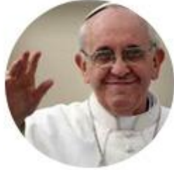
Papa Francesc Iglesia católica

"A problemes socials es respon amb xarxes comunitàries, no amb la mera suma de béns individuals" (LS, 219).