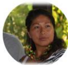
Poble Masetén Bolivia

"D'on vénen aquestes veus que clamen? Ens vénen de diferents punts com "La casa Enredadera" que dóna aixopluc a quantitat de subgrups del barri que s'organitzen per a diferents finalitats; estan els del "Banc d'aliments", que busquen aliments i després els reparteixen, els "Anti-desnonaments", els Invisibles "que acompanyen als necessitats... El Papa ens crida: Sortiu a les perifèries! No us quedeu en el vostre cercle de vida i d'acció, com si això fos l'únic que us pertoca. Hi ha molta gent que us necessita".